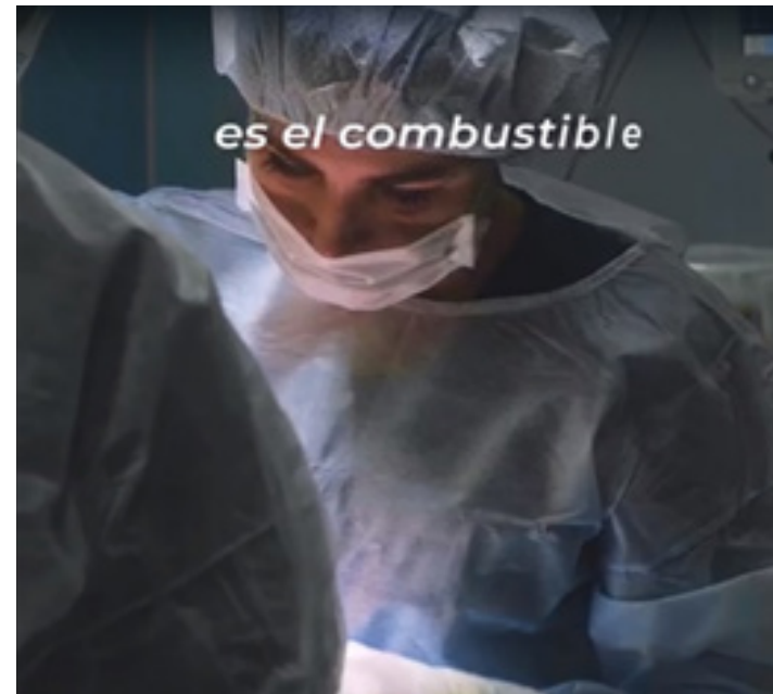
En esta actividad se realizó un video emotivo para celebrar esta fecha.