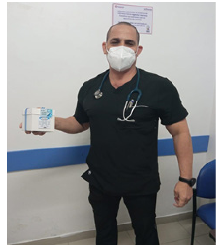
Para nosotros cada colaborador es importante y se le dio un presente por su día.