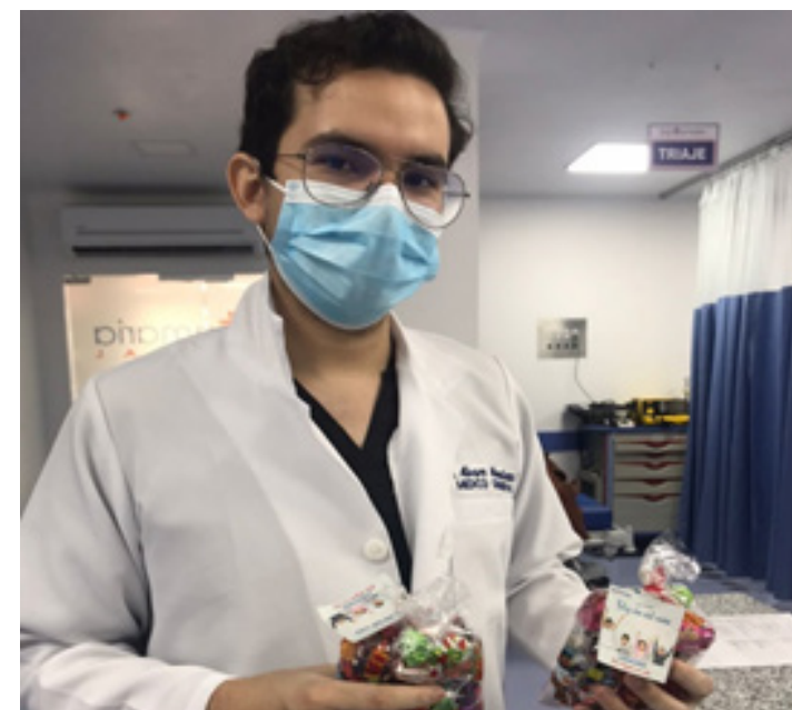
En esta actividad se entregaron fundas de caramelos para los hijos de los colaboradores